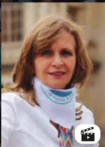
ANGELA MARÍA ROBLEDO VICE - COLOMBIA HUMANA