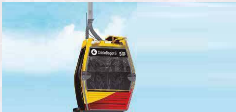
MetroCable Ciudad Bolívar

Siendo Presidente Gustavo Petro licitará de inmediato las obras del metro subterráneo de Bogotá que ya tiene los avanzados estudios de ingeniería de detalle a la altura de los mejores del mundo, con 27 estaciones, 24.5 km movilizará a 90mil pasajeros cada hora desembotellando la ciudad. Quito en Ecuador, Lima en Perú, Ciudad de Panamá y las capitales del mundo ya tienen metro subterráneo, nosotros también lo haremos.