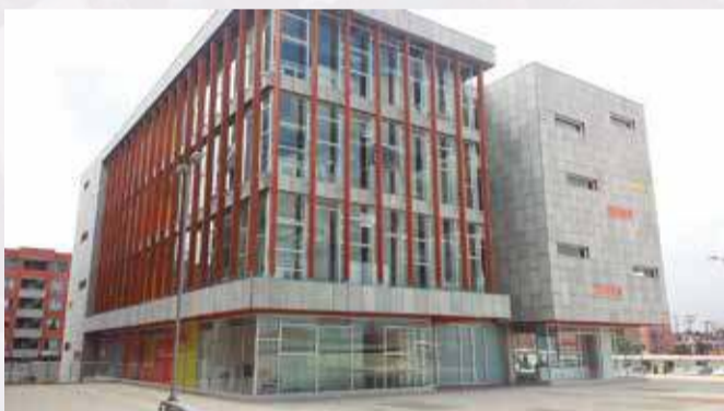
Sede Universidad Distrital Bosa Porvenir

En el gobierno de Gustavo Petro el presupuesto de la educación superior se multiplicará por cuatro, pasaremos de $3.6 Billones actuales a la suma de $14 Billones en los siguientes 4 años, permitiendo que 500 mil jóvenes bachilleres ingresen al Sena o a la Universidad Pública que serán gratuitas desde el primer año y al cuarto año de gobierno su cobertura será universal por primera vez en Colombia. Gustavo Petro hizo realidad la Universidad en Bosa, ahora lo hará en todo el país.