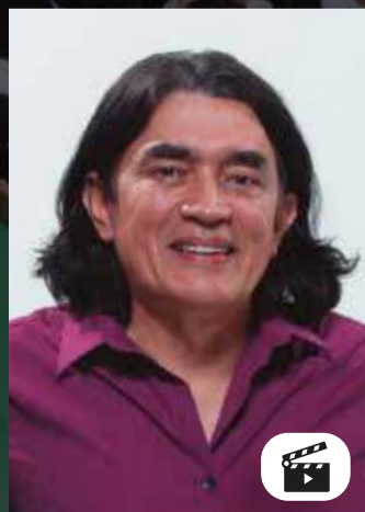
GUSTAVO BOLIVAR SENADOR