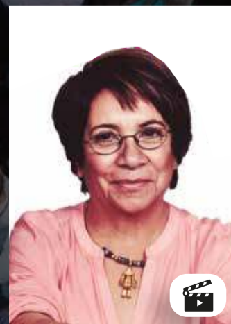
AIDA AVELLA SENADORA